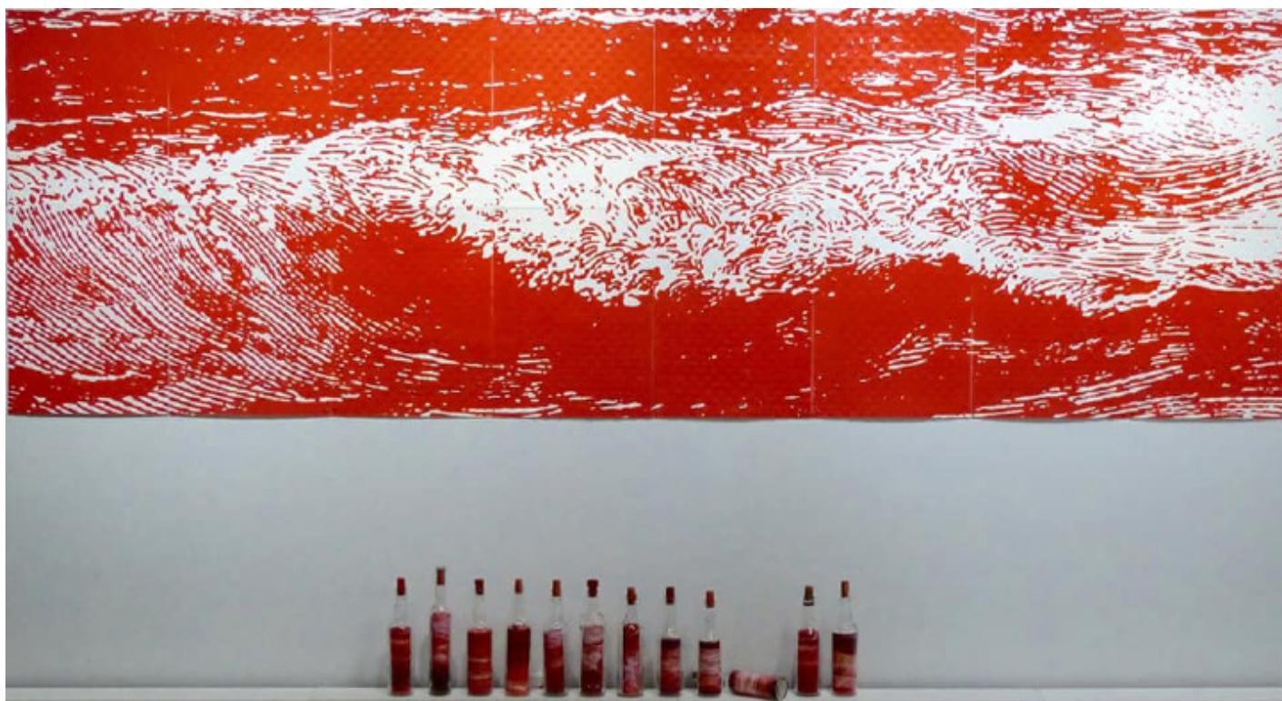
Teindre de sang les eaux tranquilles , taille d'épargne – gravure sur bois/tissage papier, 1,16m x 3,6m

Nous sommes immergées comme eux dans une dimension atemporelle, dans l'incommensurabilité du drame. L'engloutissement est un passage incognito qui échappe à notre regard, avec une perte d'identité et une absence de matérialité. Cette œuvre propose de se positionner comme une représentation de cette trace et de rendre visible cet anonymat. Elle se propose d'être le silence qui nous lie à ses êtres disparus. Elle se propose d'être une résonance et nous savons bien que les résonances passent souvent les distances temporelles et géographiques.