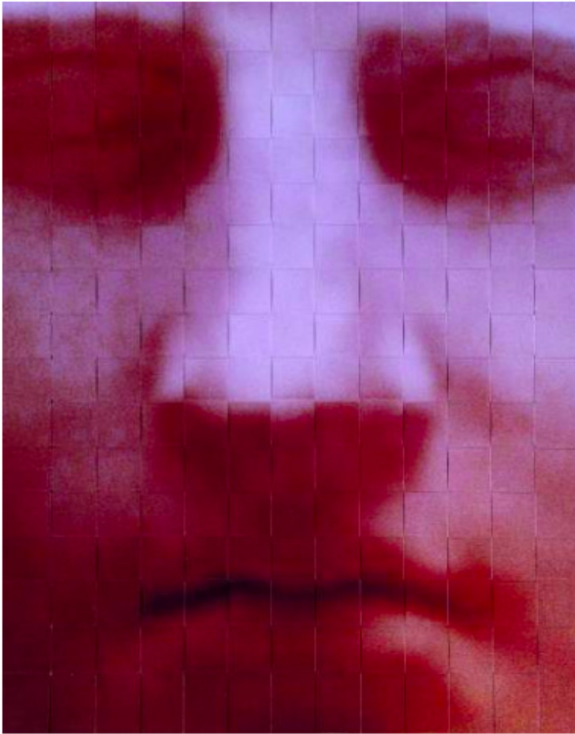
Sans titre, photographie tissée 20x 25cm (présentées en caisson en bois naturel)

Ce que l'on voit, ce que l'on ne voit pas. Le décalage des visions. La source est dans les gestes : graver, imprimer, couper, tisser. Trame, couche, superposition, morcellement, reconstitution. Reconfigurer pour rendre la même chose ou glisser légèrement d'un état vers un autre. Intériorité et extériorité. Des dialogues qui fonctionnent sur des temps différents, sur les différents territoires de la perception. Nouer une autre relation avec le temps.